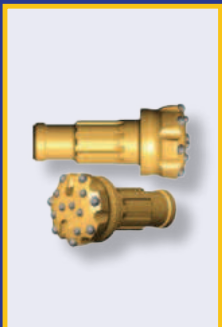
อะไหล่สิ้นเปลืองคุณภาพสูง ราคาประหยัด