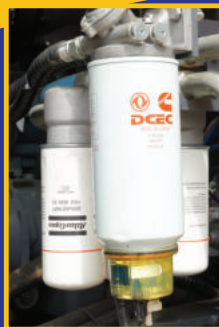
เครื่องยนต์และระบบอัดลม แบบระดับโลก (Cummins / Atlas copco)