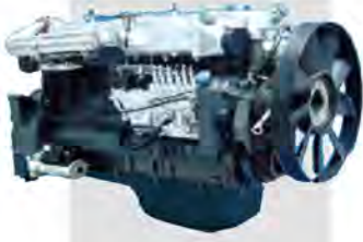
Low speed, High Torque